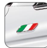
Badges drapeau italien sur ailes avant 50901681