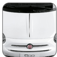
Moulure chromée sur le capot 50901691