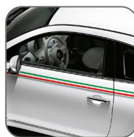
Stickers latéraux drapeau italien 50901914