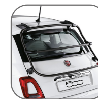
Barres aluminium sur hayon Uniquement pour versions sans spoiler arrière. (Non disponible sur 500C) 71805707