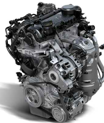
Boîte manuelle 6 rapports