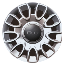
Jantes alliage 15" Original 50901665