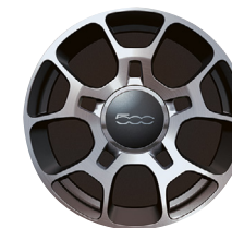
Jantes en alliage 16" Five-O-Spoke 50901669