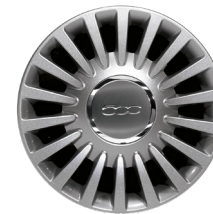
Jantes en alliage 15" Multispoke 71803943