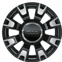
Jantes alliage 14" diamantées noir mat 5092775