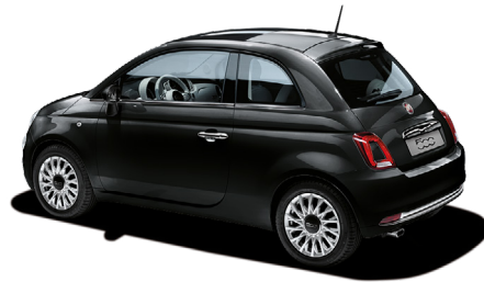
876 CROSSOVER BLACK 550 €