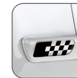
Sport noir* 50901678