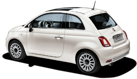
268 BOSSANOVA WHITE Gratuit