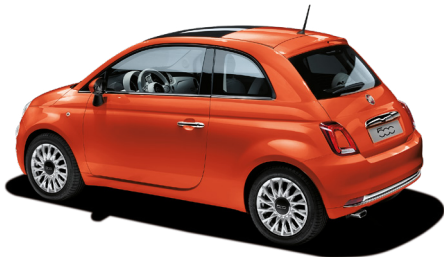
562 SICILIA ORANGE 550 €