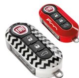
KIT DE 2 COQUES DE CLÉS : Chevron et Coral red. 50927692