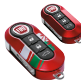
KIT DE 2 COQUES DE CLÉS ITALIE : Rouge avec drapeau italien et rouge métallisé 71805964