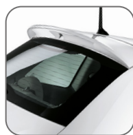
Spoiler arrière 50901672