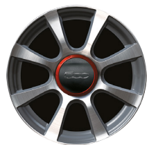
Jantes en alliage 16" By Abarth 50902469