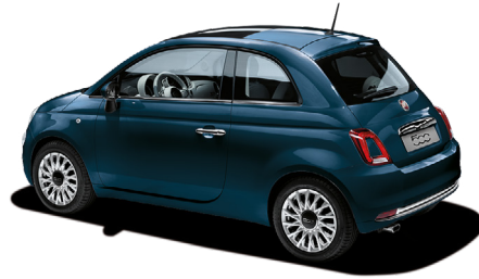
687 EPIC BLUE 550 €