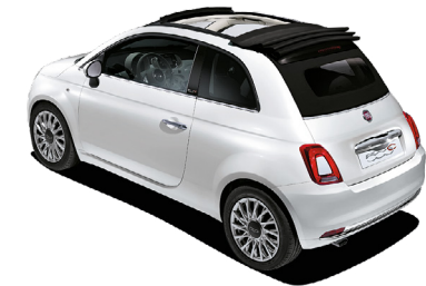
284/339 CAPOTE NOIRE