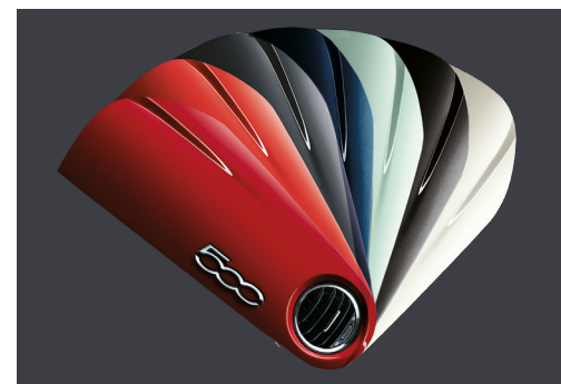
PLANCHE DE BORD

COULEUR DE LA PLANCHE DE BORD EN ACCORD AVEC LA COULEUR DE LA CARROSSERIE