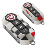
KIT DE 2 COQUES DE CLÉS SPORT : Damier et logo 500. 71805963