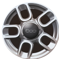
Jantes en alliage 15" Sport 71803944