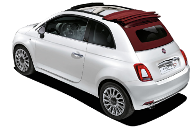
234/242 CAPOTE ROUGE