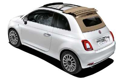
179/182 CAPOTE BEIGE