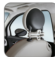
Porte veste sur appuie-tête (coloris ivoire) 50901975