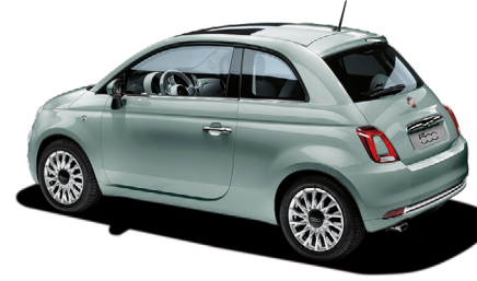
196 RUGIADA GREEN 550 €