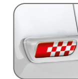
Sport rouge* 50901679