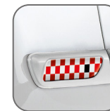
Damier rouge* 50901998