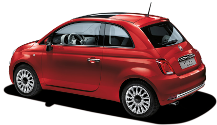
111 PASODOBLE RED 550 €